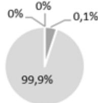
2. Investissements alignés à la taxinomie : excluant les obligations souveraines